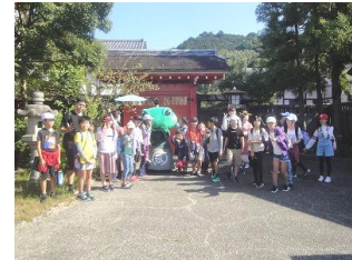
【6年：伊勢忍者キングダム】