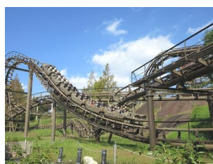
【5年：本田技研、鈴鹿サーキット】