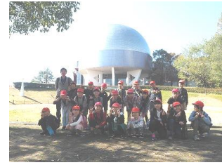
【3年：みえこどもの城】